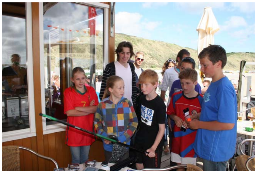
Foto's: zaterdag 12 juni 2010, familievisdag "de Zeeuwse Rivière".