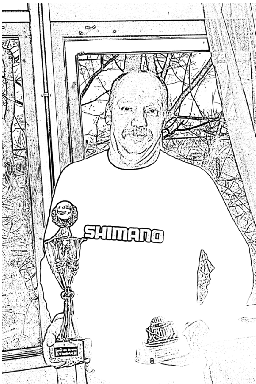
Foto: zondag 12 december 2010, winnaar Leen van Straten Cup 2010