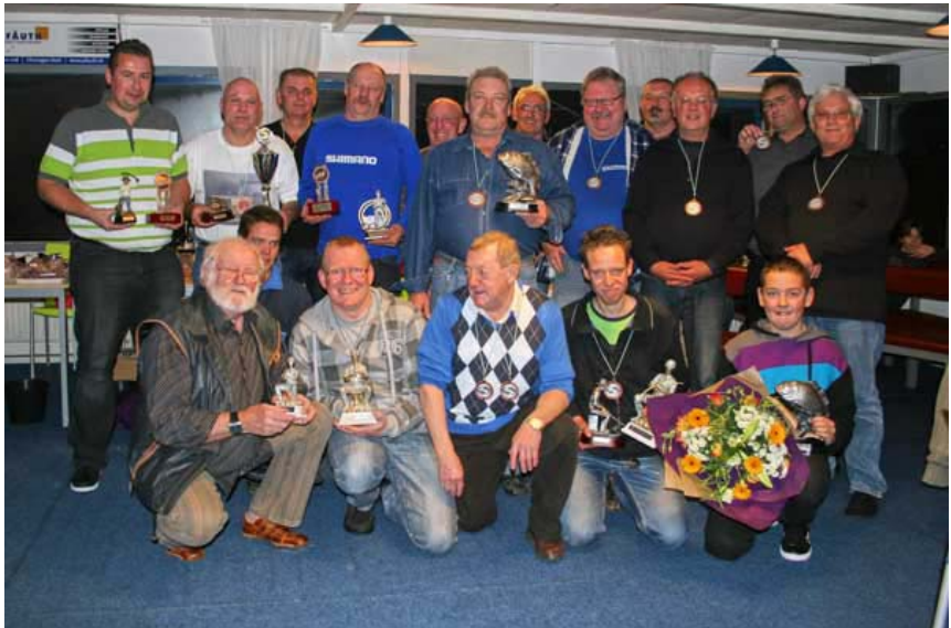
Foto: zondag 12 december 2010, Huldiging kampioenen 2010.